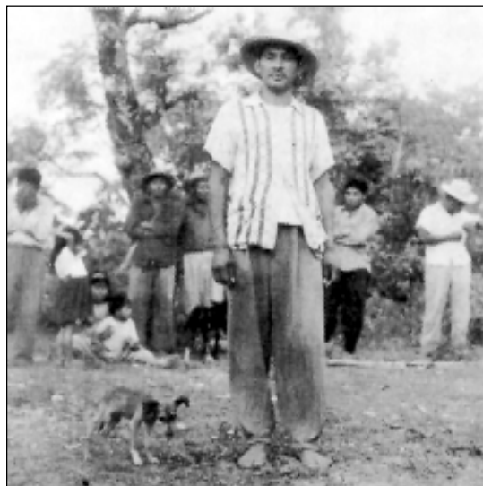
Varones Guaymies en vestimenta diaria. Hato Pílon, San Félix.

También conocen la obtención de tintura de las hojas de arbusto “Chica” ( Arrabidaea chica ), que también lo usan los Cunas continentales y del cual se obtiene una pintura roja. Los motivos geométricos tales como rayas y triángulos predominan en la decoración facial y los colores de los dos elementos comúnmente usados y ya mencionados, dan los tonos característicos negro y rojo. Se usan espátulas y moldes impresores para conseguir los diseños preferidos.