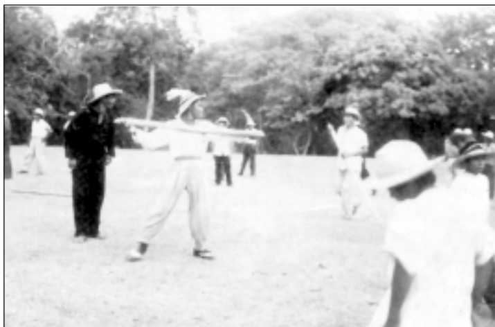
Actitud de tiro de la balsa. Cerro Alto, Tolé, 1958.