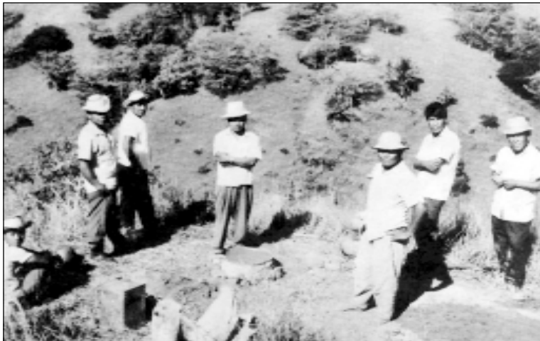
Demarcación de hitos de la tan anhelada Reserva Indígena Guaymí. Tolé, 1973.

No han sido muchos los antropólogos que han logrado obtener datos concretos sobre las manifestaciones religiosas propias de la cultura Guaymí. Quienes más éxito han logrado a ese respecto han sido los misioneros, anti-