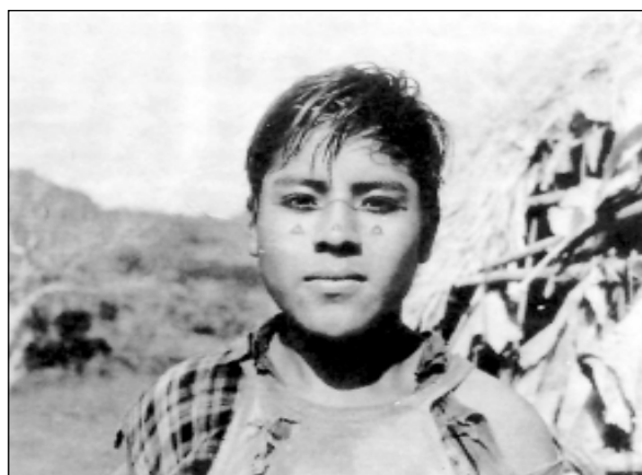
Pintura facial masculina. Cerro Otó, San Félix, Chiriquí.