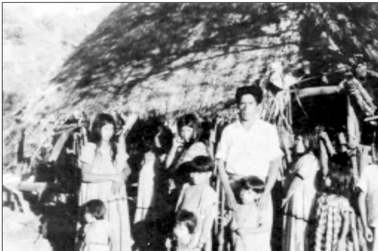
Padre de familia Guaymí con sus esposas e hijos. Cerro Culantro, San Félix, Chiriquí.

práctica motiva una gran diferencia de edad entre el hombre y su última esposa, adquirida mediante el compromiso, lo cual se traduce a veces en divorcio.