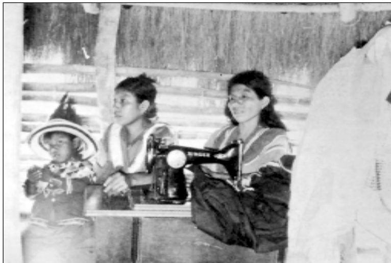
Mujeres Guaymies de matrimonio poligínico. Una de ellas se desempeña como eficiente modista. Alto Caballero, Tolé.

Durante el cortejo, que es en realidad la primera etapa del casamiento, —del cual no hay ceremonia formal— el yerno no deberá hablar con sus suegros durante las visitas de arreglos matrimoniales que hacen sus padres. El se mantiene alejado, y la futura esposa le lleva chicha y alimentos. Esta actitud de evitar la relación directa con los suegros se mantendrá de por vida. No deberá mirarlos de frente, en señal de “respeto”.