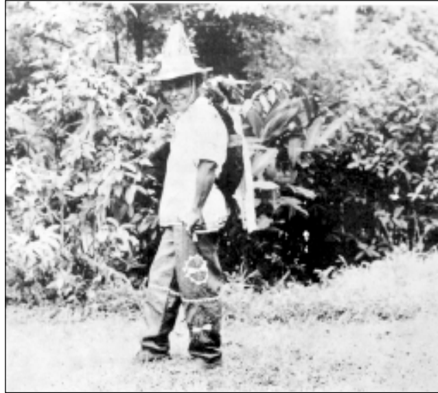
Guaymí chiricano vistiendo atuendo propio de la balsería y llevando en su espalda un gato montés disecado.