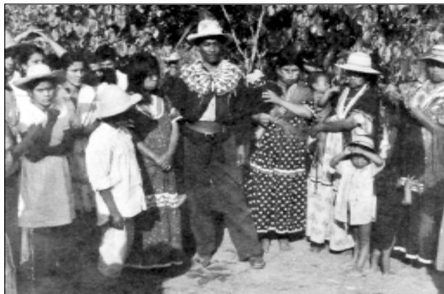
Famoso “balsero” de Veraguas, luciendo soberbio collar de chaquiras y sobre aquél, otro de dientes de saíno. Foto de los años 30.

Tres siglos después, la balsería continúa jugándose con las mismas características y detalles como la describe el misionero que las presencié varias veces en 1620. Hoy, sometida a un período de crisis, en razón de haber sido señalada como uno de los elementos indeseables por el movimiento nativista local que se hace llamar “La Nueva Orden”, el tradicional juego trata, no obstante de mantenerse. Todo parece indicar que la fuerza tradicional del mismo vencerá y que la balsería continuará perfilándose como un deporte de carácter ritual y de importancia social de primera categoría.