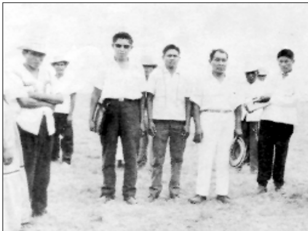
Los tres caciques Guaymés proclamados en Cerro Iglesias.

imposible. Debe haber existido una autoridad suprema, crecida en alguna persona o consejo, y luego jefes regionales o tribales que ejercían autoridad directa sobre una determinada población. Fray Adrián de Santo Tomás nos habla de jerarquías, refiriéndose al “Cabra que es la segunda persona después del cacique y su teniente en la guerra”. Nos menciona la existencia de siete caciques en la región Guaymí en la cual él entró a proseguir la obra inconclusa del padre Valderas y nos deja sus nombres para la posteridad: Borosi, Yebeque, Monugo, Menepa, Baga, Medi y Negri. Cuando se abocó a la tarea del empadronamiento de las respectivas poblaciones, los caciques le pidieron una prórroga “porque todavía faltaba mucho porque por tener muy distantes las rancherías no habían llegado”.