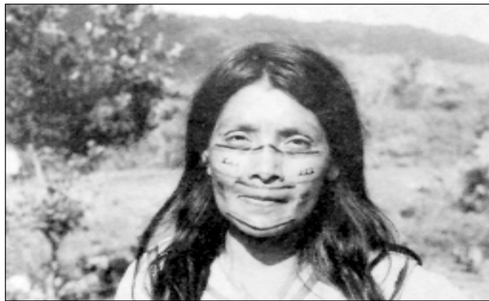
Pintura facial femenina (rojo y negro). Cerro Otó, San Félix, Chiriquí.