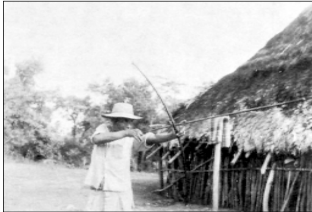
Guaymí mostrando el uso del arco y la flecha. Hato Pi-lón, Chiriquí.