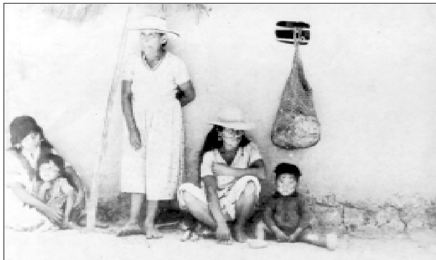
En Veraguas, un grupo de mujeres Guaymíes y sus hijos. Dos de ellas con vestidos de influencia foránea. Nótese la pintura facial de la mujer y el niño.