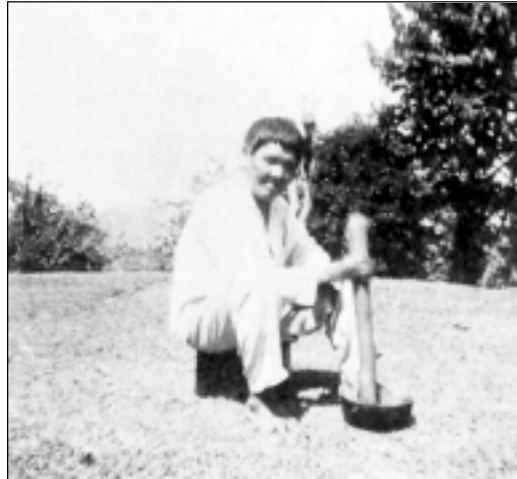
Sukia de Chiriquí, preparando sus medicinas.

A partir de ésta ceremonia, la niña ya puede iniciar su vida familiar en condición de joven casadera, puede conversar con todos y servir los alimentos. Se supone que deberá cumplir los consejos que la Bicho y demás mujeres le han dado durante la ceremonia, como garantía de un futuro feliz como mujer.