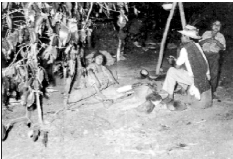
Escena de la "vela" de la balsería. Cerro Alto, Tolé. 1958.

El consumo de chichas forma parte importante del Krun o Balsería, ya que, de acuerdo con las versiones indígenas, es lo que les da fuerza para el rudo deporte. Parece tener también un cariz competitivo. “Durante el krun, el beber chicha tiene lugar en un contexto de oposición ritual de manera que, mientras es simbólico de hospitalidad por un lado, es simbólico de agresión por el otro”. 34