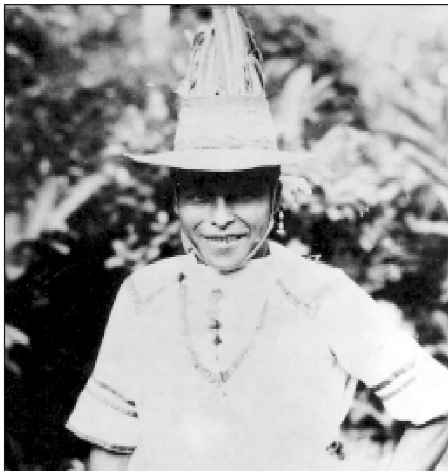
Los dientes mutilados para hacerlos puntiaguados son rasgo aún observables entre los Guaymíes.