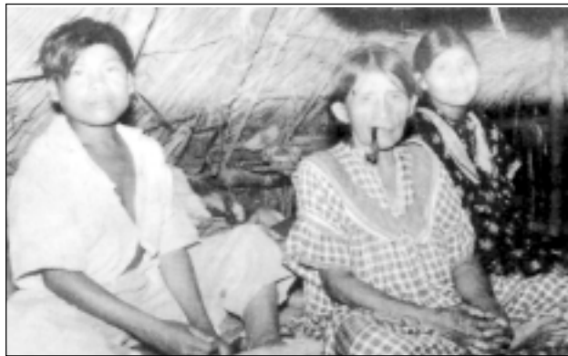
Escena de familia: la abuela con su “pipa” y los nietos. Chiriquí.

Los niños Guaymíes siempre aparecen vestidos, siendo en ello, una réplica de los adultos. Así se les ve en los caseríos, con sus madres, o bien acompañando al padre—especialmente los varoncitos—en alguna visita o diligencia. Suelen acompañar también a su padres en los viajes a los pueblos, a vender productos y adquirir mercancías.