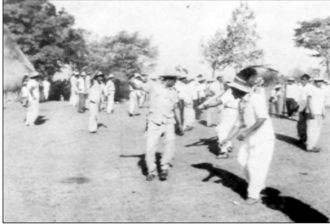
Escena de Balsería. Cerro Alto, Tolé, 1958.

juego, a manera de desafío, un caracol grande. La modulación del sonido emitido por el retador significa: “Estoy listo para ganarte y vencerte”. A través de la montaña, el rival contesta, con el mismo instrumento un mensaje de aceptación del reto: “Ven, pues”.