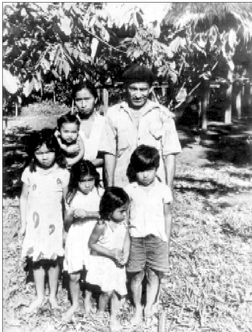
Familia compuesta de padre chiricano y madre teribe con sus hijos en el Río Teribe, Bocas del Toro.