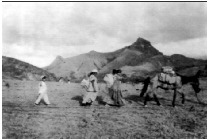
El caballo se usa primordialmente como animal de carga. Las mujeres llevan en las grandes chácaras diversos artículos y a los niños. Tabasará, Chiriquí.

Actualmente, el vestido Guaymí tanto masculino como femenino, es resultado de la aculturación ocurrida ante el temprano contacto con el europeo. La mujer, viste un atuendo que ha dado en llamarse “original”, sin que tengamos suficientes referencias comparativas con el momento del encuentro de las culturas. Los cronistas del Siglo XVI nos hablan de largas batas que usaban