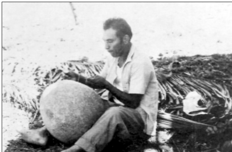
La preparación de los grandes calabazos es tarea de los hombres. Este individuo aparece cerrando los orificios de un calabazo de guardar chicha.