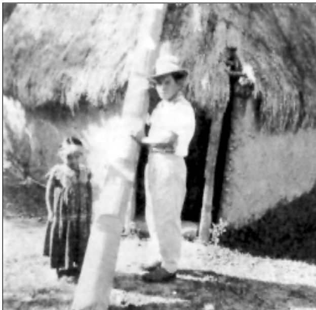
Niña Sukia, con mechón blanco. Chiriquí.

Todas estas condiciones, se exigen, pues, para ser reconocido como Sukia. Aunque la mayoría de ellos son varones, parece ser que si una niña nace con tales atributos, puede llegar a ocupar tan envidiable posición. En Alto Caballero, Chiriquí, ha sido reportada la existencia de una niña destinada a esa profesión y cuya característica exterior más representativa es un mechón blanco. 44