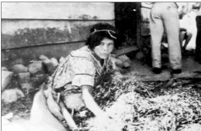
Las interminables faenas femeninas incluyen el secamiento y descaramiento de frijoles. Hato Pilon, San Félix, Chiriquí.

Dejemos hablar a la historia en boca del fraile Adrián de Santo Tomás: “... y aunque hoy perseveran en los mismos juegos que antes tenían, no empero en el desorden de ellos, uno de los más célebres es uno que hacen en el