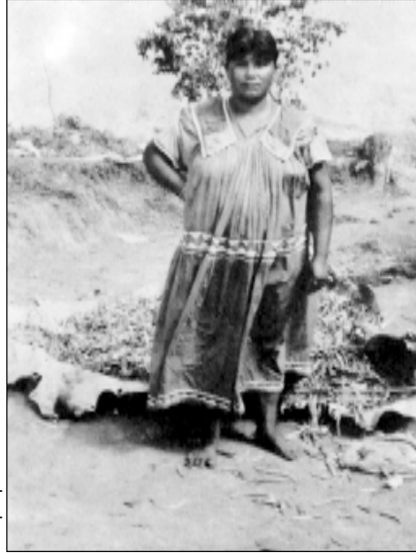
Joven Guaymí luciendo el clásico vestido. Tolé (Alto Caballero).

las “espaves” o esposas de los nobles de la región oeste de Panamá. Sin embargo, como quiera que las versiones descriptivas de los cronistas se aplican a las tribus de la vertiente del Pacífico y no a la del Atlántico, donde el grupo Guaymí tiene su ubicación histórica establecida, no podemos necesariamente establecer una correlación de origen. A ello, cabría objetar, que una versión temprana —1610— de la pluma de Fray Agustín de Ceballos nos describe para “toda esta costa, que desde el río Tariric corre hasta el Escudo de Veraguas por más de setenta leguas”, como habitada por “gente de razón, bien dispuesta y blanca, y que se visten de ropas de algodón muy bien labradas”. 26 Tal vez el aserto de Fray Adrián de Santo Tomás, de que andaban desnudos, antes de la reducción, refleje un deseo de destacar el resultado de la adopción del vestido, concebido de acuerdo a los cánones éticos y estéticos europeos. Tanto él, en el Siglo XVII, como Franco en el siguiente, nos dicen que las mujeres Guaymíes sólo se cubrían las partes sexuales, y para ello utilizaban la tela de corteza.