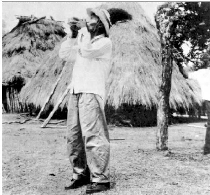
El consumo de chicha es obligante durante las balserías. Cerro Alto, Tolé, 1958.

observando de reojo todos sus movimientos y escuchando atentamente sus frases y cantos de reto. Trata de eludir el golpe brincando y levantando las piernas con agilidad y habilidad. De su destreza dependerá salir indemne o bien quedar temporalmente o permanentemente afectado de la pierna por un desgarramiento muscular o incluso por una fractura ósea. Sea cual fuere su suerte, si se encuentra en condiciones de proseguir, le toca a él inmediatamente iniciar el ataque contra quien lo retó.