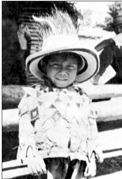
Niño de Alto Caballero, Tolé, vistiendo orgulloso una magnífica chaquira, camisa de “balseo” y precioso sombrero rematado con penacho de oso hormiguero.

La vida social Guaymí es un estrecho tejido, donde la trama y la urdimbre la componen los sistemas de parentesco sanguíneo y ritual. Esto, neutraliza el efecto negativo que el patrón tradicional de poblamiento —casas