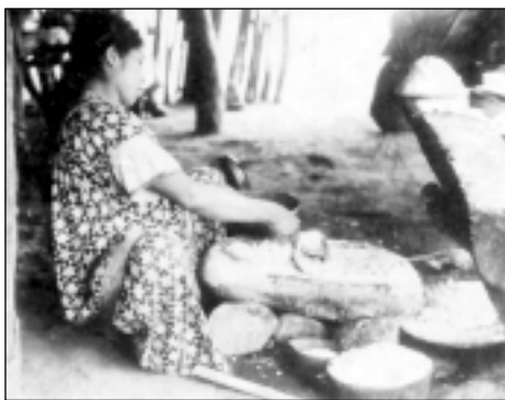
El tradicional “metate” o piedra de moler es usado diariamente por las mujeres que no han adoptado procedimientos mecanizados. Hato Pílon, San Félix, Chiriquí.

Los lazos parentales, consanguíneos y políticos, mantienen fuerte unión en la sociedad guaymí. Por esa razón, los pequeños caseríos que se han ido formando en los últimos años, responden en realidad a las interrelaciones familiares y de trabajo de los núcleos familiares emparentados. Las visitas de parientes y amigos son frecuentes, y las reuniones sociales y ceremoniales convocan muchas veces un gran número de asistentes. Hay que mencionar aquí las dos más importantes, de carácter social ambas: la balsería y la chichería. La primera de ellas, combina las características de un deporte tradicional, de ritual mágico y de fenómeno social, que pone en evidencia un interesante sistema de parentesco simbólico. El segundo, la chichería, constituye una forma social de encuentros periódicos, intercambio de opiniones, transmisión de conocimientos tradicionales, mientras que se realiza el consumo de grandes cantidades de chicha.